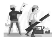
房屋维修及租赁经费

●房屋维修要履行必要的评审、审批程序，中大维修项目要纳入预算管理，无预算，不实施。日常维修原则由公用经费统筹。房屋租赁应结合我市现有办公用房控制情况，优先调剂，确需租赁的，也要多家比价。