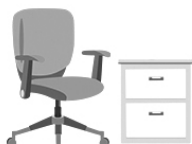
设备、器材、家具购置经费

●未新增人员，原则上不安排新购；新增人员的，内部无法调剂，且从市本级公物仓中无法选择，才允许按标准安排。