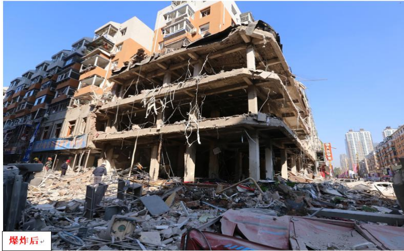
发生爆炸的盛王二牛烧烤店