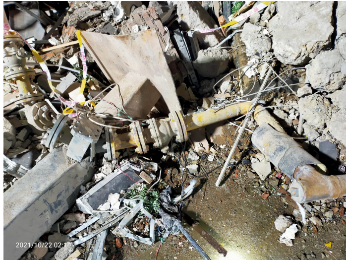
事故现场盛王二牛烧烤店进户引入管