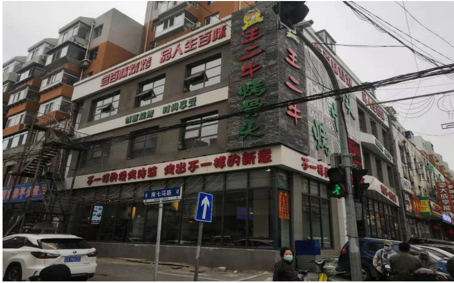
盛王二牛烧烤店（事故发生前）